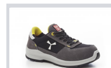
S0104 STEEL GREY/NERO