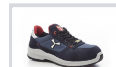
S0300 BLU NAVY/SEAPORT