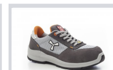
S1003 STEEL GREY/LIGHT GREY