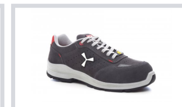
S1005 STEEL GREY