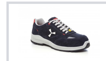
S0301 BLU NAVY