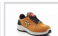
S0100 GIALLO ASPEN