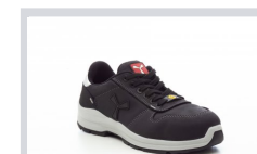
S0000 TOTAL BLACK